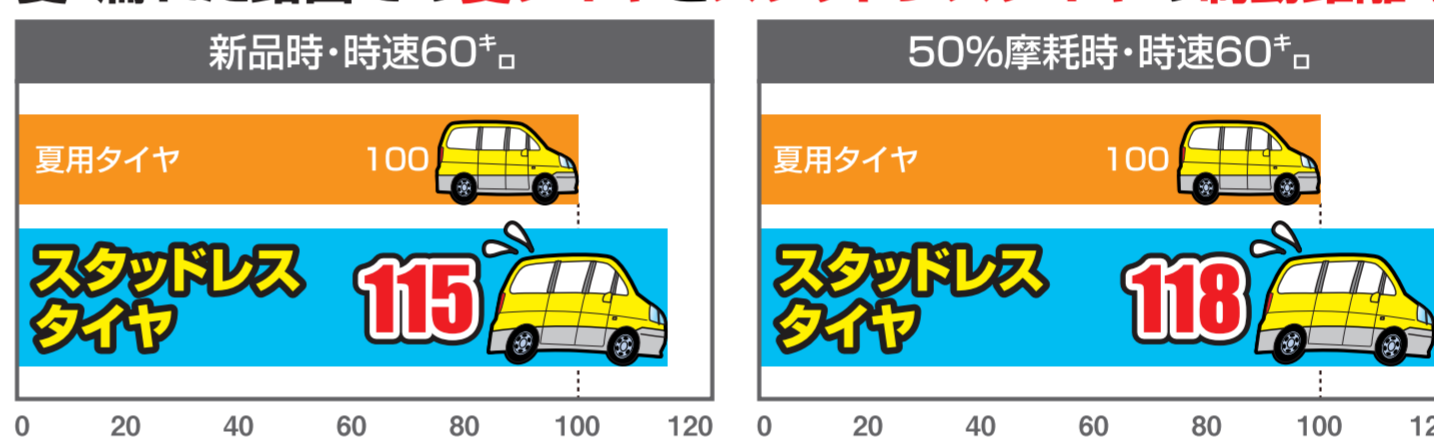
夏・濡れた路面での夏タイヤとスタッドレスタイヤの制動距離の比較

2014年 JATMA「自動車用タイヤの選定、使用、整備基準」より 各条件での夏用タイヤの制動距離を100として指数表示し、指数が大きい方が制動距離が長いことを示す。グラフは下記の条件での試験結果での例示です。 試験条件・実施場所: JAF総合試験路・路面の種類: アスファルト(湿潤)・タイヤサイズ: 195/65R15 ・車種: 乗用車(2000cc、前席2名乗車)・空気圧: 車両指定空気圧、220kPa